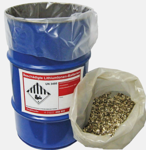
60 l Metallfass mit Inlaysack