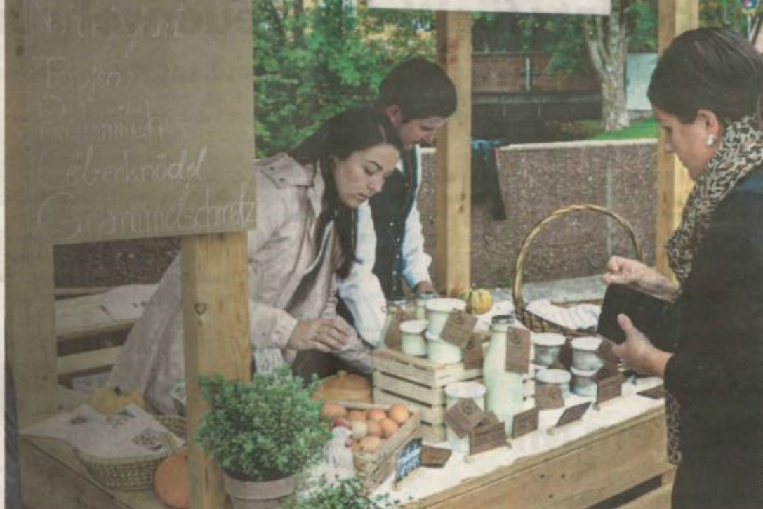
Reger Andrang herrschte beim ersten Obertrumer Bauernmarkt. 18 Standler boten ihre regionalen Produkte an. Mehr dazu erfahren Sie auf Seite 7.