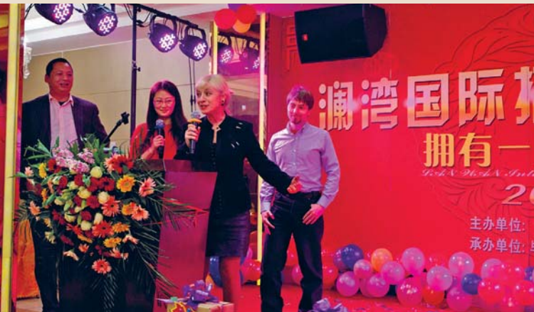
„Dfeng 2“, 2015, C-Print, 30 x 40 cm