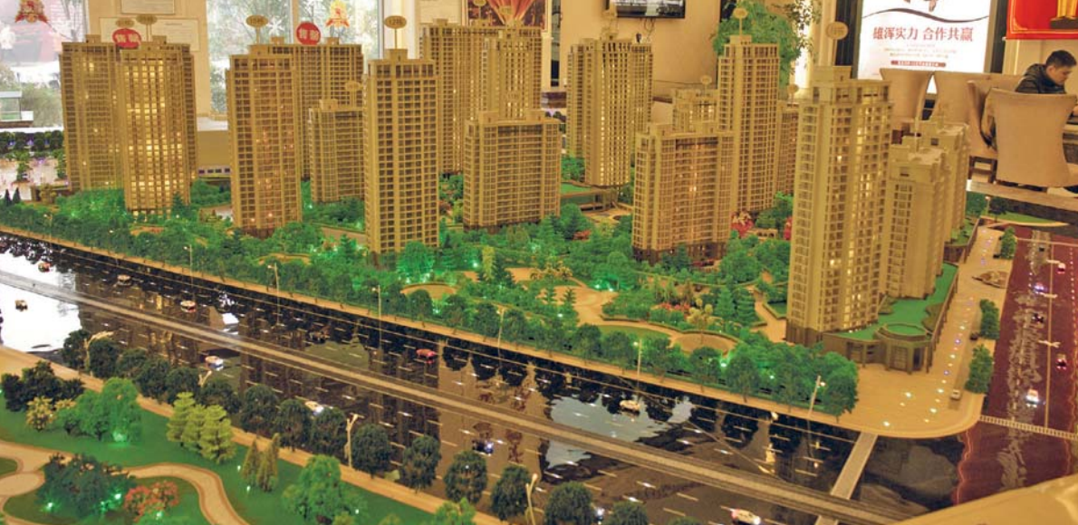
„Modell Huai An 3“, 2015, C-Print, 90 x 115 cm

1954 born in Milan, Italy; since 1982 she lives and works mainly in Salzburg.