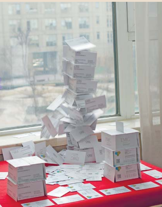
„house of cards 2“ (Detail), 2015, C-Print, 46 x 70 cm

The photo series House of Cards represents a sculptural complement to the purely documentary photos.