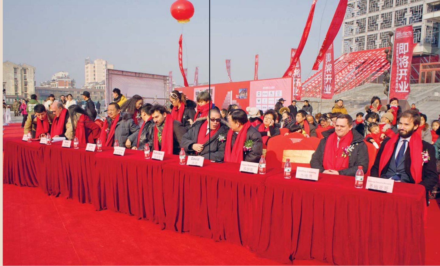
„Ehregäste“, 2015, C-Print, 90 x 115 cm

The Galerie im Traklhaus is showing photographic works in the room beside the entrance to the Fortress museum; here topical contemporary art is juxtaposed with the historical exhibition.