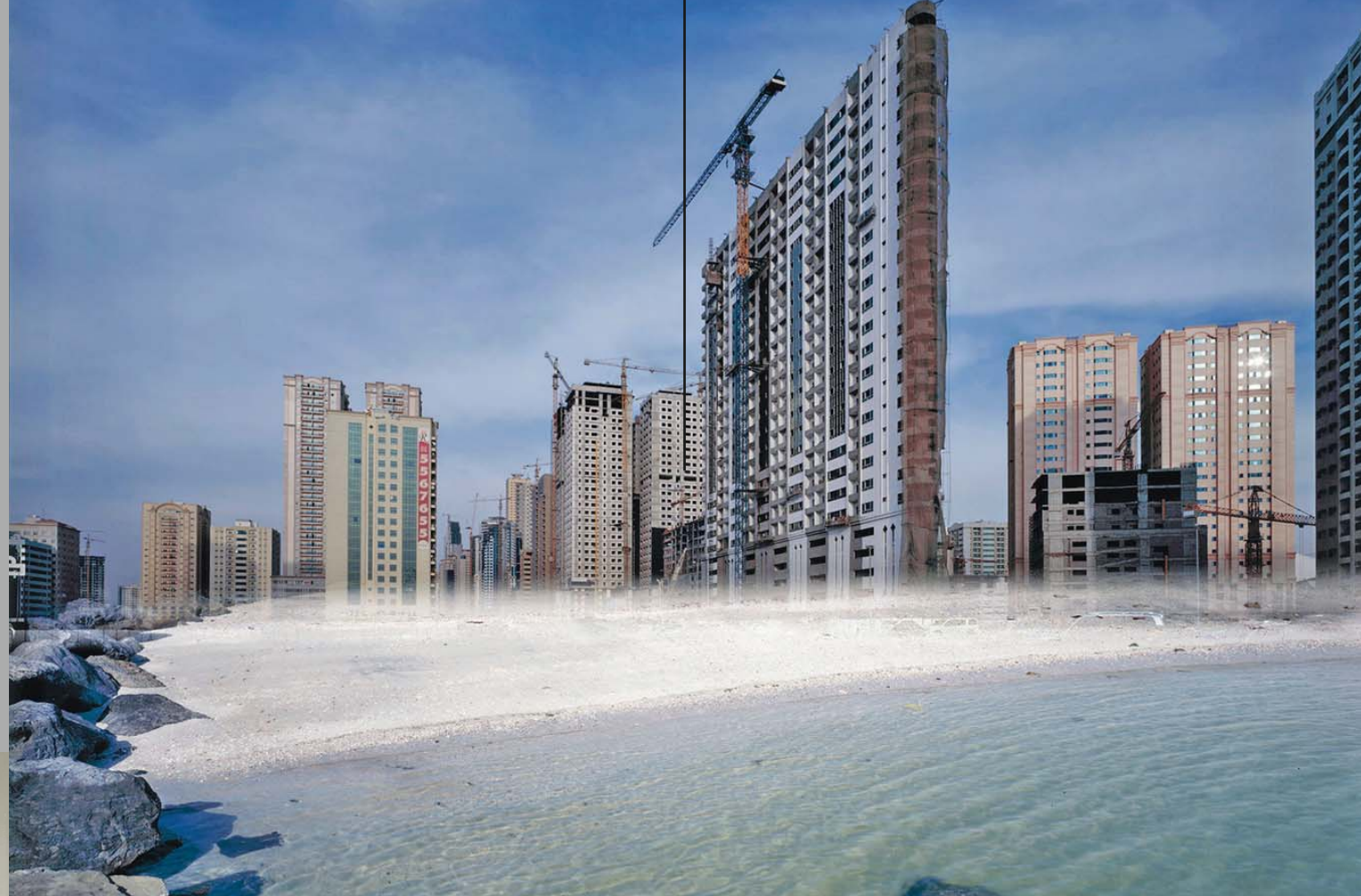
„Beach Scrapers #1“, 2009, C-Print, 90 x 115 cm

Konrad Rainer zeigt Fotografien, die während seines Auslandsaufenthaltes 2009 in Sharjah (Vereinigte Arabische Emirate) entstanden sind. Er arbeitet in seiner Fotokunst ausschließlich analog; durch Mehrfachbelichtungen werden architektonische und landschaftliche Elemente wie Knetmassen in neue Kontexte gepresst, die Titel sind oftmals Ergebnisse dieser Synthesen.