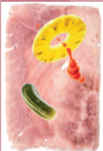
„Americas“, 2008, C-Print, 112 x 300 cm

„Water Textures“: These pictures are taken in 2004 with Ferran Adrià at his restaurant elBulli in Spain.