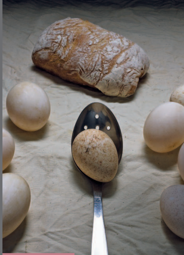
aus „Americas“, 2008, C-Print, 120 x 80 cm