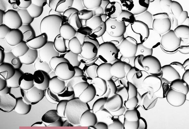
„Water Textures“, 2004, SW-Print, 83,5 x 125 cm