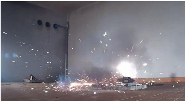
Explodierende Batterie

Während diese Batterien bei sachgemäßem Einsatz sicher sind, führt der hohe Energieinhalt jedoch dazu, dass sich diese Batterien bei Beschädigung oder unsachgemäßem Gebrauch selbst entzünden können. Beschädigungen sind dabei nicht notwendigerweise sichtbar sondern können auch im Inneren der Batterie stattfinden.