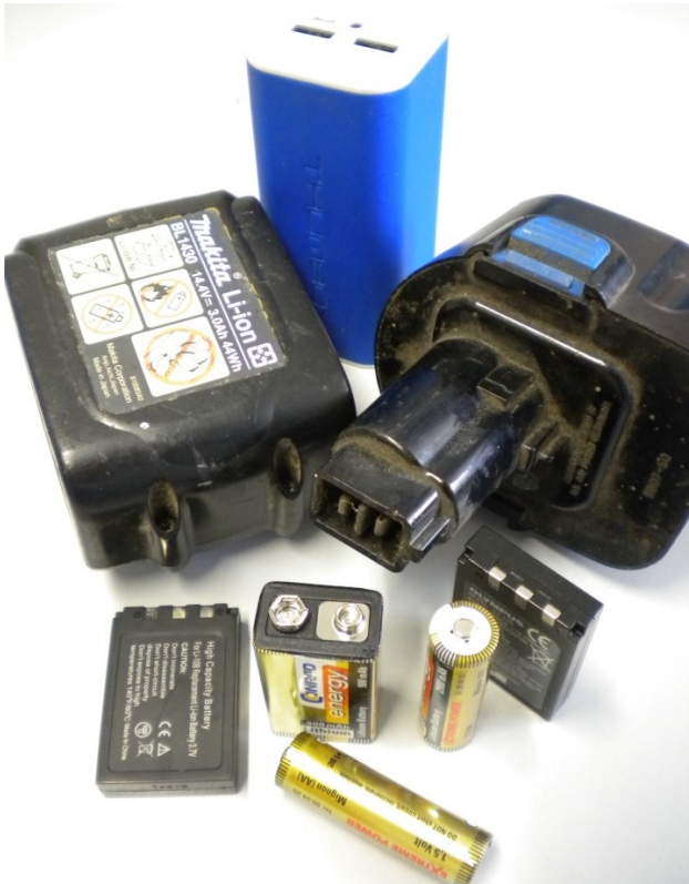
Gängige Li-Batterie und Akkumodelle

Handys, Digitalkameras, Laptops, E-Books, E-Fahrräder, Werkzeuge, Modellbau, Navigationsgeräte, Spielzeug, Messgeräte etc.