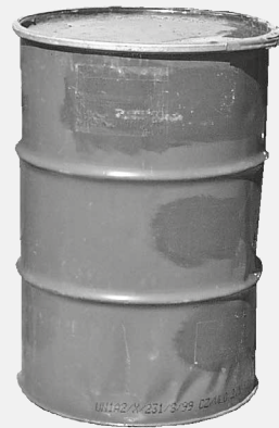
200 l Deckelfass

Das Fass während der Öffnungszeiten geschlossen halten.