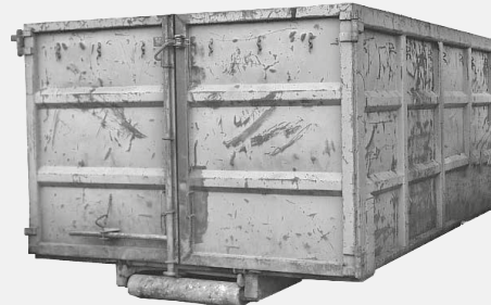
25-30 m 3 Abrollcontainer oder Sammelmulde