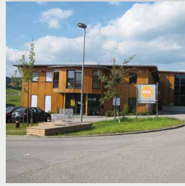
Naturnaher Eingangsbereich, mit Rasengittersteinen am Parkplatz

Es ist kein Naturgesetz, dass ein Gewerbegebiet zur Gänze „zuasphaltiert“ sein muss, mit einigen einfachen Maßnahmen kann es zusätzlich zu seiner betrieblichen Hauptfunktion auch in das Landschaftsbild integriert sein und einen Lebensraum für Tiere und Pflanzen bieten. Eine ansprechende Gestaltung von Gewerbegebieten ist gerade im Oberpinzgau besonders wichtig. Einerseits spielt hier der Tourismus eine große Rolle und andererseits liegt das Salztal im Vorfeld des Nationalparks Hohe Tauern. Im Rahmen des LEADER-Projekts „Mustergewerbegebiete Oberpinzgau“ wurden u.a. folgende Maßnahmen beschrieben, um die Einbindung von Gewerbegebieten in die Landschaft zu verbessern.