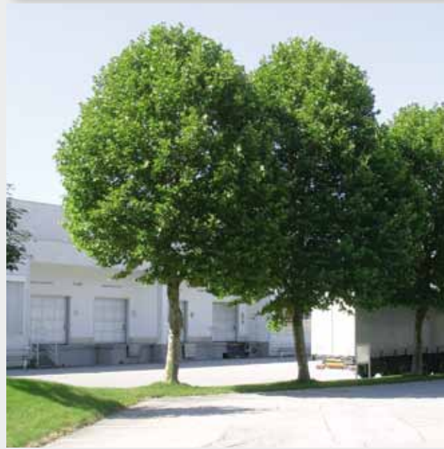
Durchgrünung eines Gewerbegebiets