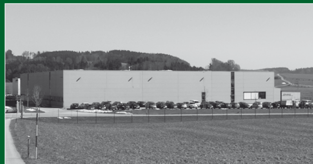
Gewerbegebiet auf der grünen Wiese

Das Gewerbegebiet Palfinger in Köstendorf lässt sich hinter dem Pflanzstreifen noch erahnen wirkt aber nicht wie ein massiver Fremdkörper in der Landschaft.