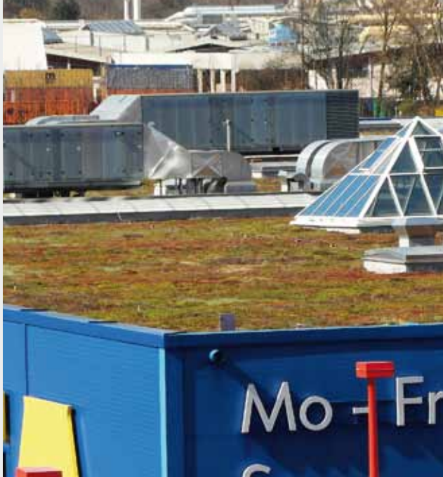
Betriebsgebäude mit extensiver Dachbegrünung