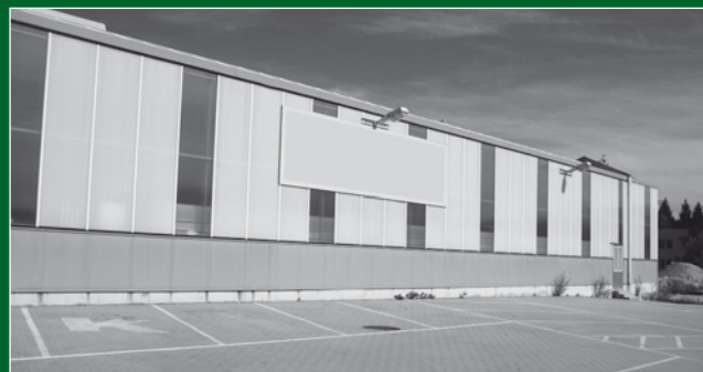
Halle mit stark versiegelter Parkfläche

Ein- und Durchgrünung bieten darüber hinaus heimischen Tieren und Pflanzen Lebensräume und tragen zum Biotopverbund bei.