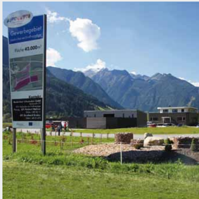
Gewerbegebiet Neukirchen: einladend für Besucher und Kunden