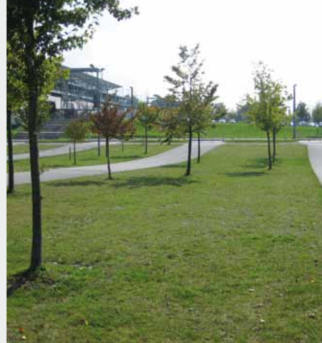
Verbesserte Versickerung durch Schotterrassen am Parkplatz