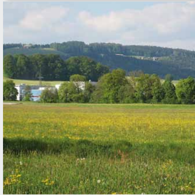
Gewerbegebiet hinter einem Gehölzstreifen