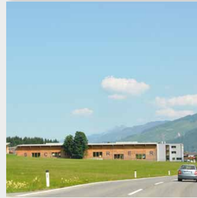
Anpassung von Material, Farbe, Architektur