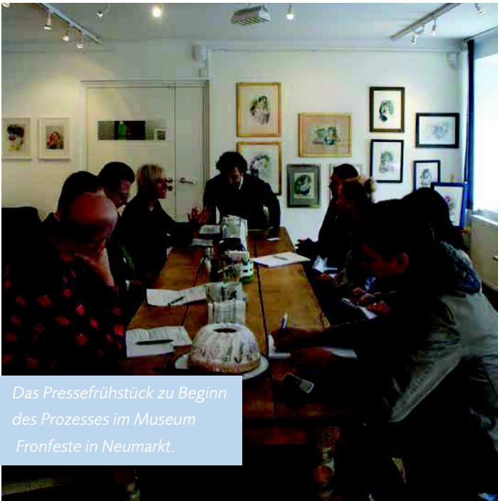
Das Pressefrühstück zu Beginn des Prozesses im Museum Fronfeste in Neumarkt.