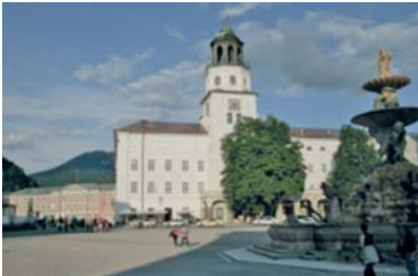
Abb. 21 Die „Neue Residenz“ in der Salzburger Altstadt, in der sich seit 2006/07 das „Salzburg Museum“ befindet.

Das reiche kulturelle Erbe von Salzburg wird in zahlreichen Museen der interessierten Öffentlichkeit präsentiert. In vielen Gemeinden gibt es Heimatmuseen, die sich vor allem der Bewahrung der lokalen Überlieferung und Tradition widmen. Für den Bereich der prähistorischen Sammlungen verfügt das „Keltenmuseum Hallein“ über Bestände von europäischem Rang.