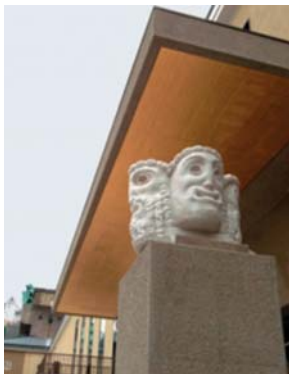
Abb. 19 Das 2006 fertiggestellte „Haus für Mozart“ – Detail des Eingangsbereichs.

Untrennbar verbunden mit dem kulturellen Leben in Salzburg und seiner internationalen Bedeutung sind die Salzburger Festspiele, die bald nach 1945 wieder jenen Weltruf erlangen konnten, den sie in den Jahren vor dem Zweiten Weltkrieg erreicht hatten. Maßgeblichen Anteil daran hatte der Dirigent Herbert von Karajan, der in der zweiten Hälfte des 20. Jahrhunderts bis zu seinem Tod 1989 die Festspiele künstlerisch prägte und entscheidend dazu beitrug, dass sie bis heute zu den weltweit wichtigsten kulturellen Veranstaltungen zählen.