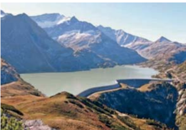
Abb. 12 Kraftwerk Tauernmoos der Kraftwerksgruppe Stubachtal.

Im März 1938 hörte Österreich durch den „Anschluß“ an das nationalsozialistische Deutschland auf, ein unabhängiger Staat zu sein. Anfang September 1939 begann mit dem deutschen Überfall auf Polen der Zweite Weltkrieg. Rund 10.000 Salzburger fielen in diesem Krieg als Soldaten an den verschiedenen Fronten. Mehr als 500 Bewohner dieses Landes starben in ihrer Heimat durch alliierte Luftangriffe. In der Salzburger Altstadt verursachten diese Bombenangriffe 1944/45 große Schäden an historischen Gebäuden. Auch das größte Gotteshaus des Landes, der Salzburger Dom, wurde im Bereich der Kuppel schwer beschädigt und erst 1959 konnte er nach umfangreichen Reparaturarbeiten neu eingeweiht werden. Zahlreiche Salzburger wurden Opfer des verbrecherischen nationalsozialistischen Unrechtsregimes – sie wurden in Konzentrationslager unter grausamsten Umständen getötet, von Gerichten zum Tode verurteilt oder als Behinderte und unheilbar Kranke ermordet.