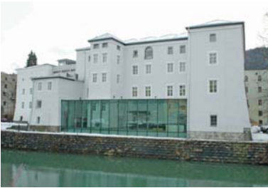
Abb. 1 Das „Keltenmuseum Hallein“, wo viele Funde aus archäologischen Ausgrabungen am benachbarten Dürrnberg ausgestellt sind.

Bereits in der älteren Steinzeit (800.000 bis 18.000 v. Chr.) lebten Menschen auf dem Gebiet des heutigen Bundeslandes Salzburg. Damals waren große Teile des Landes mit Eis bedeckt, und die Bewohner waren nicht sesshaft, sondern folgten als Jäger dem Wild. Erst mit der Besserung des Klimas wurden Ackerbau und Viehzucht möglich. Einen ersten Aufschwung erlebte Salzburg in der Bronzezeit, als es gelang, Werkzeuge und Geräte aus Metall herzustellen.