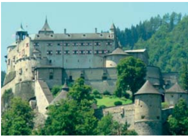
Abb. 4 Die Festung Hohenwerfen.

Die katholische Kirche hatte jahrhundertlang eine besonders mächtige Position in Salzburg, denn das Land wurde vom Mittelalter bis zum Beginn des 19. Jahrhunderts (1803) von einem Erzbischof regiert, der neben seiner religiösen Funktion auch weltlicher Herrscher war – über Jahrhunderte hinweg war das Land Salzburg ein eigenständiges geistliches Fürstentum und kam erst 1816 endgültig zu Österreich. Als Zentrum einer großen Kirchenprovinz dehnte es seinen Einfluss weit über die Grenzen des heutigen Bundeslandes hinaus aus.