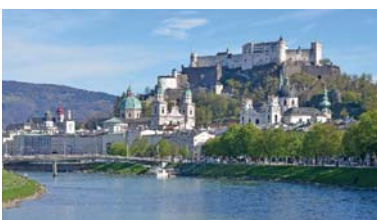
Abb. 5 Die Altstadt von Salzburg mit dem barocken Dom und der beherrschenden Festung Hohensalzburg seit 1. Jänner 1997 auf der UNESCO-Liste des Weltkulturerbes.

Der Reichtum des Landes fand auch seinen Niederschlag in den prächtigen Bauten, die unter den Erzbischöfen in der Stadt Salzburg errichtet wurden. Diese Bauwerke prägen bis heute das Antlitz der Altstadt von Salzburg – am 1. Jänner 1997 wurde die Altstadt in die UNESCO-Liste des Weltkulturerbes aufgenommen.