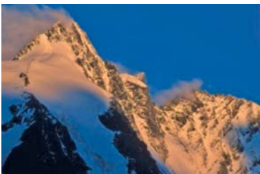
Abb. 22 Der seit 1971 bestehende Nationalpark Hohe Tauern, an dem die Bundesländer Salzburg, Kärnten und Tirol Anteil haben, bewahrt eine unvergleichliche Landschaft.

Die bedeutendsten kulturellen Schätze zur Geschichte Salzburgs werden im „Salzburg Museum“, dessen Anfänge bis in die Mitte des 19. Jahrhunderts zurückreichen, aufbewahrt. Seit 2006/07 zeigt es seine reichen Sammlungen in der Salzburger Altstadt in einem Palast am Residenzplatz, in der sogenannten „Neuen Residenz“. Dieser Palast, der ursprünglich von den Salzburger Erzbischöfen genutzt wurde, bietet ideale Voraussetzungen, dass die umfangreichen Bestände dieses Museums in zeitgemäßer Form präsentiert werden können. Darüber hinaus werden im „Salzburg Museum“ häufig Sonderausstellungen zu verschiedenen Themen veranstaltet.