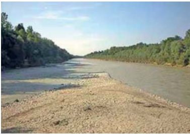
Abb. 23 „Saalachspitz“, Zusammenfluss von Salzach und Saalach, den beiden wichtigsten Flüssen des Bundeslandes, nördlich der Landeshauptstadt Salzburg.

Mit einer Fläche von etwas mehr als 7.000 km 2 zählt es zu den kleineren österreichischen Bundesländern. Der größte Teil des Landes wird von Hochgebirge dominiert. Der höchste Berg des Bundeslandes ist der Großvenediger (3.674 m). Von den fünf politischen Bezirken des Landes liegt nur der Bezirk Salzburg-Umgebung zum Großteil im Flachland – er wird daher auch als „Flachgau“ bezeichnet.