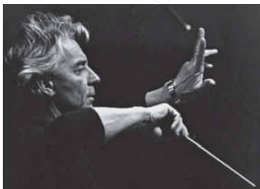
Abb. 18 Herbert von Karajan, der bis zu seinem Tod 1989 über Jahrzehnte die Salzburger Festspiele entscheidend prägte.

Eine Ergänzung und Ausweitung des wissenschaftlichen Angebots auf dem Gebiet von Lehre und Forschung in Salzburg ist die „Paracelsus Medizinische Privatuniversität“, die im Herbst 2003 ihren Betrieb aufnahm.