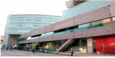
Abb. 30 Landeskrankehaus Salzburg – Universitätsklinikum der Paracelsus Medizinischen Privatuniversität.

Das zentrale Krankenhaus (Landeskrankehaus Salzburg) für das Bundesland Salzburg ist das St. Johannis-Spital, das sich in der Landeshauptstadt im Stadtteil Mülln befindet.