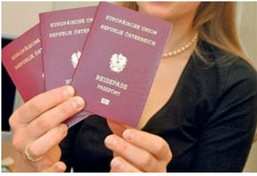
Abb. 34 Österreichischer Reisepass, der bei jeder Passbehörde beantragt werden kann.

Voraussetzung für Reisen ins Ausland ist ein gültiges Reisedokument – für die Staaten der Europäischen Union genügt ein Personalausweis. Für die meisten übrigen Staaten der Erde benötigt man jedoch einen Reisepass, der nach Vorlage der dafür nötigen Dokumente bei jeder Passbehörde beantragt werden kann.