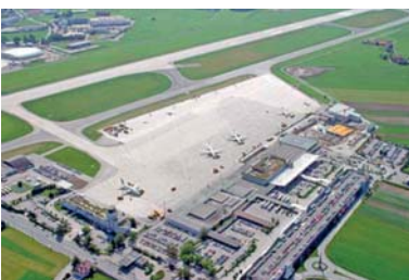
Abb. 14 Der „Salzburg Airport W.A. Mozart“, einer der wichtigsten österreichischen Bundesländerflughäfen.

Länger dauerten die Arbeiten an der Tauernautobahn (A 10), der wichtigsten Nord-Süd-Straßenverbindung im Bundesland Salzburg. 1975 wurde die sogenannte „Scheitelstrecke“ der Tauernautobahn dem Verkehr übergeben. Hier waren der Bau der zahlreichen Tunnel (z. B.: Tauerntunnel: 6,4 km, Katschbergtunnel: 5,4 km) und Brücken besonders aufwändig. Seit der Fertigstellung des Katschbergtunnels besteht erstmals eine Autobahnverbindung zwischen den Bundesländern Salzburg und Kärnten. 1979 konnten im Land Salzburg die Arbeiten an der Tauernautobahn abgeschlossen werden.