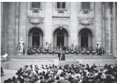
Abb. 9 Aufführung des „Jedermann“ von Hugo von Hofmannsthal auf dem Domplatz bei den ersten Salzburger Festspielen 1920.

Die Zwischenkriegszeit (1918-1939) war auch in Salzburg von großen wirtschaftlichen und sozialen Problemen als Folge der Niederlage im Ersten Weltkrieg geprägt. Trotzdem gab es auf vielen Gebieten wichtige Fortschritte, die teilweise die Voraussetzungen für die erfolgreiche Entwicklung des Bundeslandes nach dem Zweiten Weltkrieg bildeten.