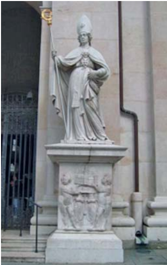
Abb. 3 Statue des Heiligen Rupert vor dem heutigen Salzburger Dom.

Ende des 8. Jahrhunderts ließ der aus Irland stammende Bischof Virgil den ersten Salzburger Dom errichten. Der Bau ist einer der Vorgängerbauten der heutigen Domkirche. Dieses Gotteshaus, das 774 fertiggestellt wurde, befand sich bereits ungefähr dort, wo sich der heutige Salzburger Dom befindet.