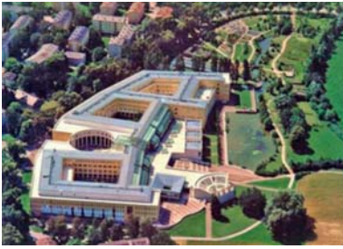
Abb. 17 Das 1986 fertiggestellte Gebäude der Naturwissenschaftlichen Fakultät der Universität in der Stadt Salzburg (Freisaal).

Ein sichtbares Zeichen für die Bedeutung der Universität ist in der Stadt Salzburg, in Freisaal, der 1986 fertiggestellte, großzügige und architektonisch hochwertige Neubau der Naturwissenschaftlichen Fakultät. In der Innenstadt befinden sich ebenfalls eine Reihe universitärer Einrichtungen, die teilweise in historischen Gebäuden in der Salzburger Altstadt untergebracht sind.