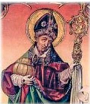
Abb. 2 Mittelalterliche Darstellung des Hl. Rupert, Landespatron von Salzburg.

Vor rund 2.000 Jahren eroberten die Römer den Alpenraum, und auch Salzburg kam zum Römischen Reich. Die Römer regierten das Gebiet des heutigen Bundeslandes rund 500 Jahre lang. Zentrum wurde die Stadt Juvavum, die sich im Bereich der heutigen Altstadt der Landeshauptstadt Salzburg befand. Die römische Herrschaft brachte in den folgenden Jahrhunderten in vielen Bereichen große Fortschritte, beispielsweise wurde das Straßennetz großzügig ausgebaut. Die Zeit der Völkerwanderung beendete Ende des 5. Jahrhunderts die Herrschaft der Römer und auch Juvavum wurde dem Verfall preisgegeben. Ein großer Teil der Bevölkerung flüchtete in Richtung Süden, nach Italien.