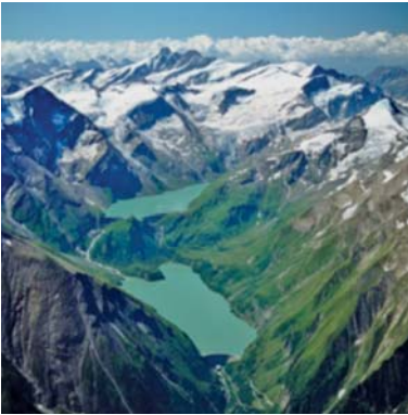
Abb. 13 Die Stauseen Mooserboden und Wasserfallboden der 1955 fertiggestellten Tauernkraftwerke Kaprun – bereits während der NS-Zeit wurde mit dem Bau dieses Speicherkraftwerks begonnen.

Nach Überwindung der größten Not in den ersten Nachkriegsjahren setzte auch in Salzburg ein Wirtschaftsaufschwung ein. Viele Betriebe wurden modernisiert und auch der Fremdenverkehr erholte sich relativ rasch – immer mehr Touristen kamen wieder ins Land und brachten zusätzliche Einnahmen für die heimische Wirtschaft.