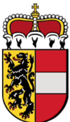
Abb. 26 Das Salzburger Landeswappen.

Die kleinste Einheit des politischen Lebens bildet die Gemeinde. Das Land Salzburg gliedert sich auf dieser Ebene in 119 Gemeinden, an deren Spitze ein Bürgermeister steht. Dieser wird ebenfalls alle fünf Jahre bei den Gemeindevertretungs-/Gemeinderats- und Bürgermeisterwahlen gewählt. Bei diesen Wahlen ist jeder österreichische Staatsbürger und jeder Staatsbürger anderer Mitgliedsstaaten der Europäischen Union mit Hauptwohnsitz in der jeweiligen Gemeinde, der das 16. Lebensjahr vollendet hat, wahlberechtigt.