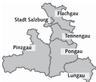
Abb. 25 Die politischen Bezirke in Salzburg: Bezirk Hallein (Tennengau) Bezirk Salzburg-Umgebung (Flachgau) Bezirk St. Johann (Pongau) Bezirk Tamsweg (Lungau) Bezirk Zell am See (Pinzgau) (Stadt Salzburg).

Derzeit sind, gemäß dem Ergebnis der letzten Landtagswahl vom 5. Mai 2013, fünf politische Parteien im Landtag vertreten; die ÖVP mit 11 Mandaten, die SPÖ mit 9 Mandaten, die Grünen mit 7 Mandaten, die FPÖ mit 6 Mandaten und das Team Stronach mit 3 Mandaten. Wahlberechtigt bei Landtagswahlen ist jeder österreichische Staatsbürger mit Hauptwohnsitz im Land Salzburg, der das 16. Lebensjahr vollendet hat.