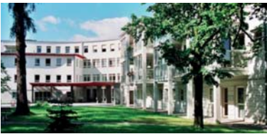
Abb. 31 Christian-Doppler-Klinik – Universitätsklinikum der Paracelsus Medizinischen Privatuniversität.

Das zentrale Krankenhaus (Landeskrankehaus Salzburg) für das Bundesland Salzburg ist das St. Johannis-Spital, das sich in der Landeshauptstadt im Stadtteil Mülln befindet.