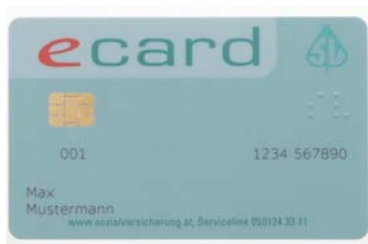
Abb. 32 Die „e-card“, die vom jeweiligen Krankenversicherungsträger aus- gestellt wird.

Dieses moderne Krankenhaus hat als Universitätsklinikum gemeinsam mit der Christian-Doppler-Klinik im Stadtteil Liefering zudem große Bedeutung für die medizinische Forschung bzw. die Ausbildung angehender Mediziner, die an der „Paracelsus Medizinischen Privatuniversität“ studieren. Überdies ist es Ausbildungsstätte für den Krankenpflegenachwuchs und medizinisch-technische Akademie.