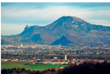
Abb. 10 Der Gaisberg im Osten der Stadt Salzburg, auf den seit 1929 eine Autostraße führt.

Der Bau eines eigenen Festspielhauses (1925-1927) ermöglichte eine Ausweitung des Spielplans und aufwändige Inszenierungen. Diese Aufführungen trugen neben dem „Jedermann“ auf dem Domplatz dazu bei, die Salzburger Festspiele weltweit bekannt zu machen. Salzburg wurde bald zum Treffpunkt der besten Regisseure und Dirigenten, Schauspieler und Sänger ihrer Zeit. Ein Schwerpunkt der Festspiele ist seit den Anfangsjahren die Musik von Wolfgang Amadeus Mozart.