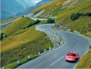
Abb. 11 Die in der Zwischenkriegszeit errichtete Großglockner Hochalpenstraße – seit 1935 hochalpine Verbindung zwischen Salzburg und Kärnten.

Das zweifellos bekannteste Straßenbauprojekt der Zwischenkriegszeit ist die Großglockner Hochalpenstraße. Die feierliche Eröffnung dieser Pass-Straße, die in den Sommermonaten die Bundesländer Salzburg und Kärnten verbindet, erfolgte nach rund fünfjähriger Bauzeit im August 1935. Heute benützen jährlich Millionen von Touristen die Großglockner Hochalpenstraße, die beim „Hochtor“ auf 2.504 m Seehöhe ihren höchsten Punkt erreicht und einen eindrucksvollen Blick auf die Bergriesen um den Großglockner eröffnet.