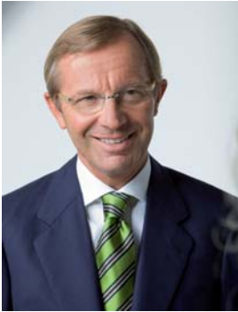
Abb. 24 Landeshauptmann Dr. Wilfried Haslauer.

Oberstes Vollzugsorgan im Land ist die Landesregierung. Der Landeshauptmann ist Vorsitzender der Landesregierung und leitet deren Sitzungen. Insgesamt besteht die Salzburger Landesregierung aus sieben Mitgliedern – derzeit zwei Frauen und fünf Männer.