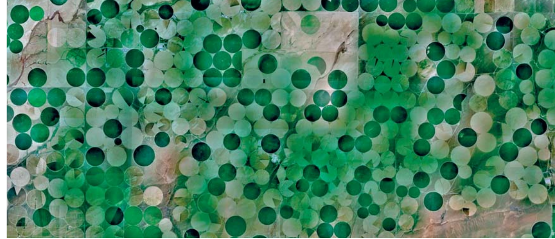
AERIAL VIEWS, 2009

„The focus of subjectivity is a distorting mirror.“ – Hans-Georg Gadamer