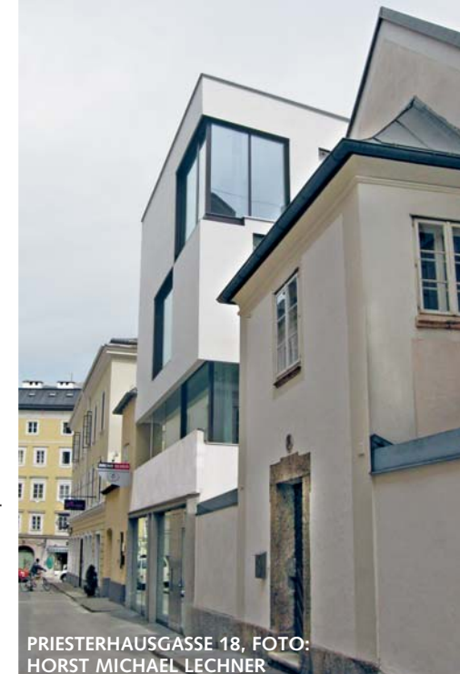
PRIESTERHAUSGASSE 18