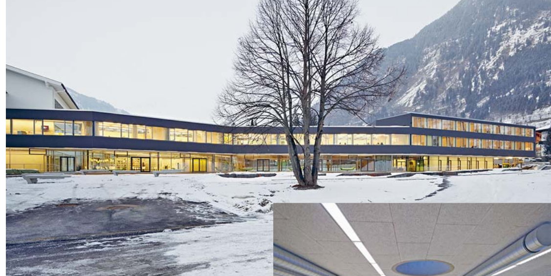
TOURISMUSCHULE BAD HOFGASTEIN

Das aus einem internationalen Wettbewerb als Siegerprojekt hervorgegangene Projekt für die Erweiterung der Tourismusschule Bad Hofgastein wird seitens der Jury als überzeugender Beitrag in vielerlei