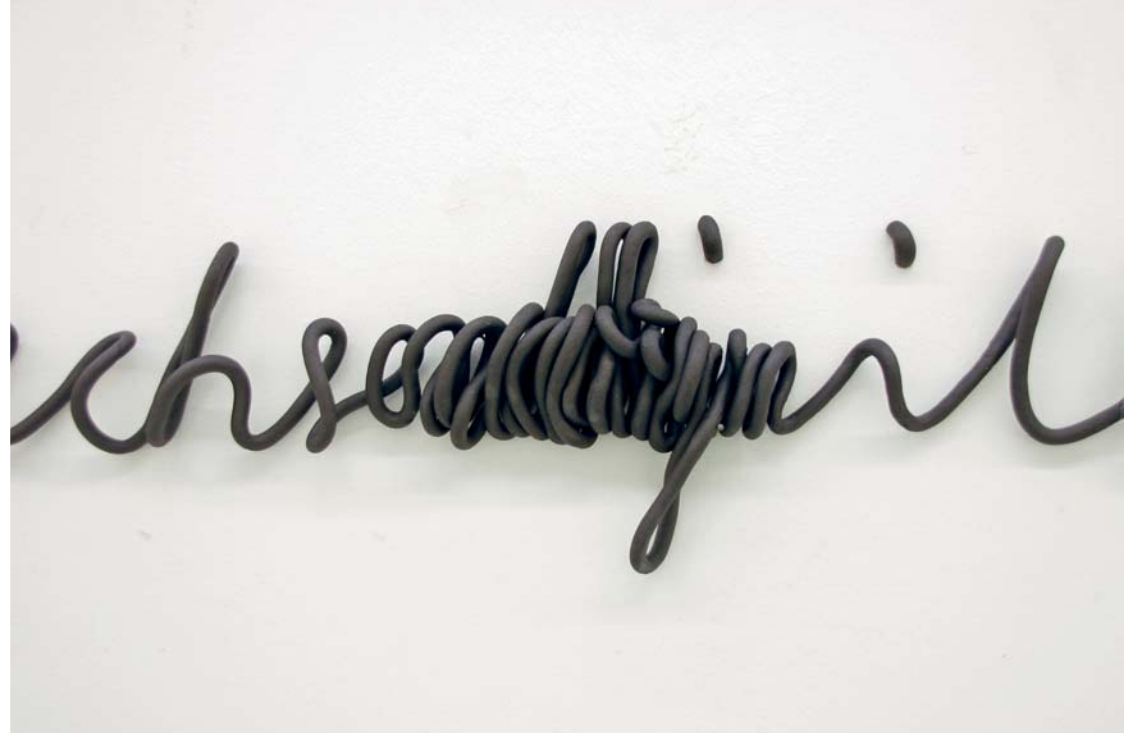
DETAIL DER ARBEIT „IN WORTEN“, 2009, KERAMIK, 510 X 20 X 4 CM (AUSSCHNITT 60 CM)

So ist zum Beispiel Sprache ein wesentliches und wiederkehrendes Ele- ment in ihren Werken. Unter anderem formt sie Wörter aus Tonrollen zu Texten oder Phrasen, die zum einen auf die jeweiligen Orte reagieren und zum anderen zeitkritische Gesellschaftsreferenzen im Umgang mit Sprache und Kommunikation sind.