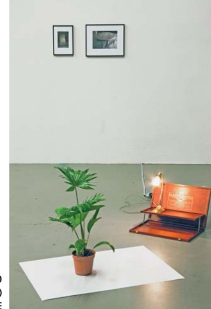
„POLYGRADES“, 2010 MIXED MEDIA INSTALLATION (DETAILANSICHT) VARIABLE GRÖSSE

Rechercheergebnis und objet trouvé keine sichtbare Grenze ziehen. Ihre Displays erzeugen mitunter abweichende, irritierende Wahrnehmungen und befragen die gängigen Lesarten von Inhalten, die ihrerseits bereits vollständig ver- und erfasst schienen.