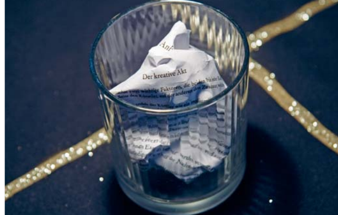
„PORTRAIT MANQUÉ“, 2009 MIXED MEDIA INSTALLATION (DETAIL) VARIABLE GRÖSSE