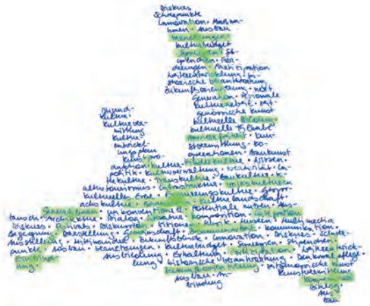
Illustration: Martina Mühlfellner

Dazu benötigt es die gemeinsame Anstrengung aller am künstlerischen und kulturellen Leben in Salzburg beteiligten und interessierten Akteurinnen und Akteure. Dem Land ist es dabei besonders wichtig, dass