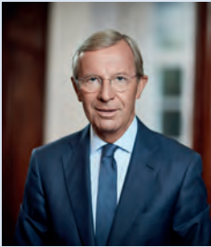
Wilfried Haslauer Landeshauptmann

„Es ist wichtige Aufgabe der Kulturpolitik, materielle und immaterielle Rahmenbedingungen sicherzustellen, welche das freie und möglichst vielfältige Stattfinden von Kultur ermutigen und ermöglichen.“