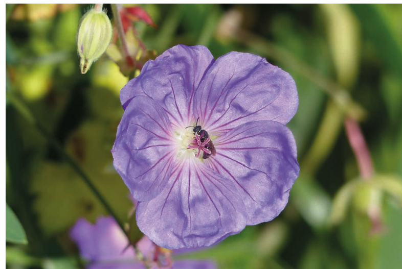
Wildbienen sind aufgrund ihrer Größe zum Teil kaum zu erkennen.

Die Männchen dieser Insektengruppe, die Drohnen, besitzen keinen Stachel. Gerade für Kinder, aber auch für Erwachsene ist es spannend, Wildbienen beim Bau der Brutzellen zu beobachten. Aufgrund der verschiedenen Wildbienenarten können vom Frühjahr bis in den Herbst Wildbienenarten in verschiedenen Lebensräumen beobachtet werden.