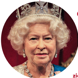
IN „MADAME TUSSAUDS“ WACHSFIGUREN-KABINETT.