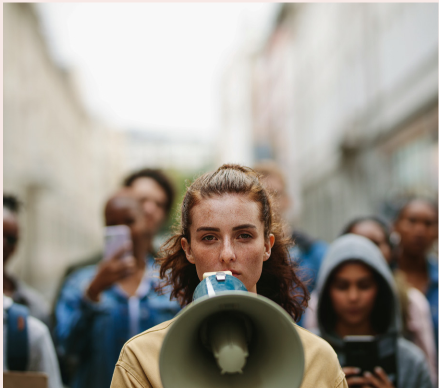
Die Stimme erheben: Macht ist auch ein Instrument, sich durchzusetzen.

Die sogenannte Männermacht wird ambivalent wahrgenommen. Macht in der Außenwelt erscheint einerseits erstrebenswert, weil sie Freiheit, Geld und Gestaltung verspricht, andererseits hat sie aber keinen guten Ruf. Männer werden für die Unterdrückung der Frauen, für Gewalt und Kriege verantwortlich gemacht. Außerdem wird Frauen von Politik und Medien immer wieder vermittelt, dass sie keinesfalls wie Männer auftreten sollten. Sie müssten vielmehr weiblich führen, weiblich verhandeln und ihre Netzwerke weiblich gestalten. Dieser starke Druck verunsichert und schwächt viele Frauen. Ich frage mich aber schon lange, was denn diese neue „Weiblichkeit“ eigentlich sein soll: die gute Mutter oder die erotische Frau in der Chefetage? Meine Empfehlung an Frauen lautet daher, sich weniger Gedanken über die Geschlechterfrage zu machen, sondern die Spielregeln der Arbeitswelt zu kennen, um eigene Ziele zu erreichen – und vor allem mit weniger Kraftaufwand.