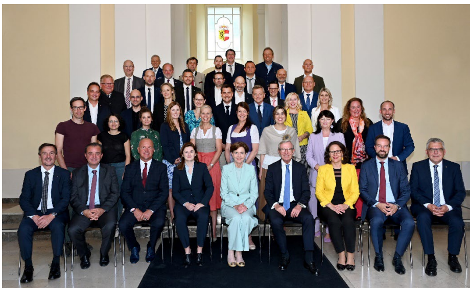
Die Abgeordneten im Salzburger Landtag 2023

Zum Beispiel: Wenn Abgeordnete wollen, dass die Landes-Regierung für eine bestimmte Sache mehr Geld ausgibt.