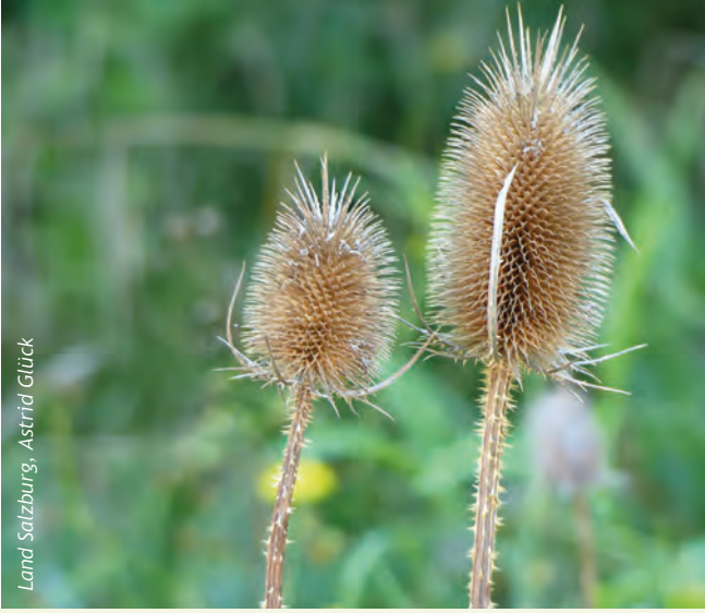
Wilde Karde als Vogelfutter stehen lassen!