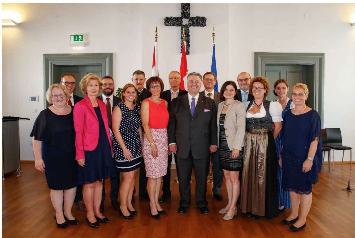
Die Mitarbeiterinnen und Mitarbeiter des Landesrechnungshofes bei der 25-Jahr-Feier