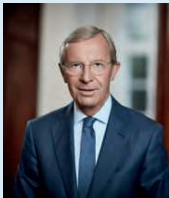
Wilfried Haslauer Landeshauptmann

„Es ist wichtige Aufgabe der Kulturpolitik, materielle und immaterielle Rahmenbedingungen sicherzustellen, welche das freie und möglichst vielfältige Stattfinden von Kultur ermutigen und ermöglichen.“