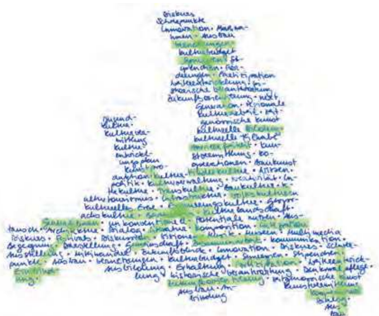
Illustration: Martina Mühlfellner

die Künstlerinnen und Künstler, die Kulturarbeitenden und Kulturarbeitenden sowie die Vertreterinnen und Vertreter der zahlreichen Kunst- und Kultureinrichtungen in allen Regionen und Gemeinden auf Augenhöhe mit eingebunden werden.