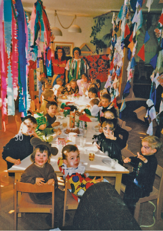
Immer bunt: Fasching in der Schanzlgasse 14.