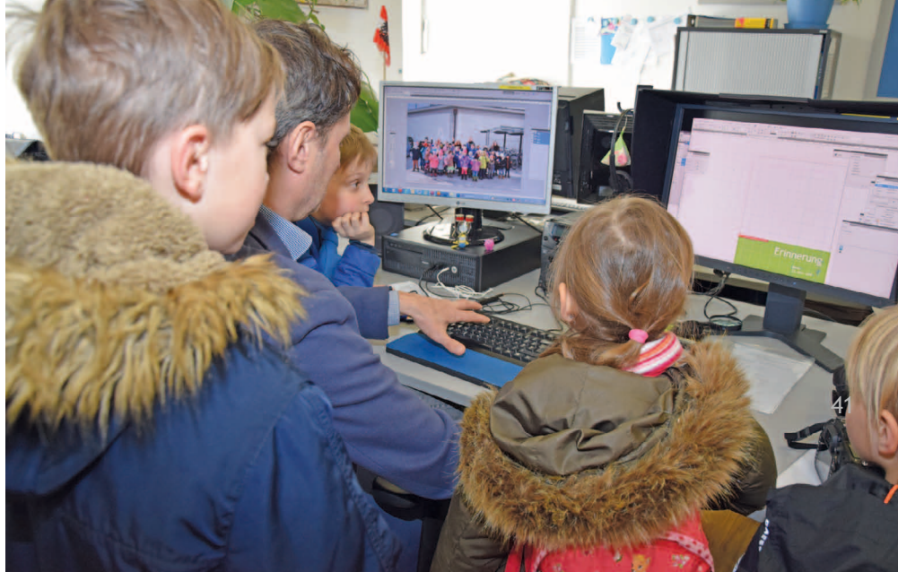
Besuch in der Grafik des Landes, gemeinsam mit Kindern der Volksschule Nonntal.

in der Schanzlgasse ist angenehm, humorvoll, familiär... Unser Kind geht sehr gerne in die Krabbelstube! Das ist der beste Indikator dafür, dass ihr eure Arbeit wunderbar macht! Danke euch herzlich!