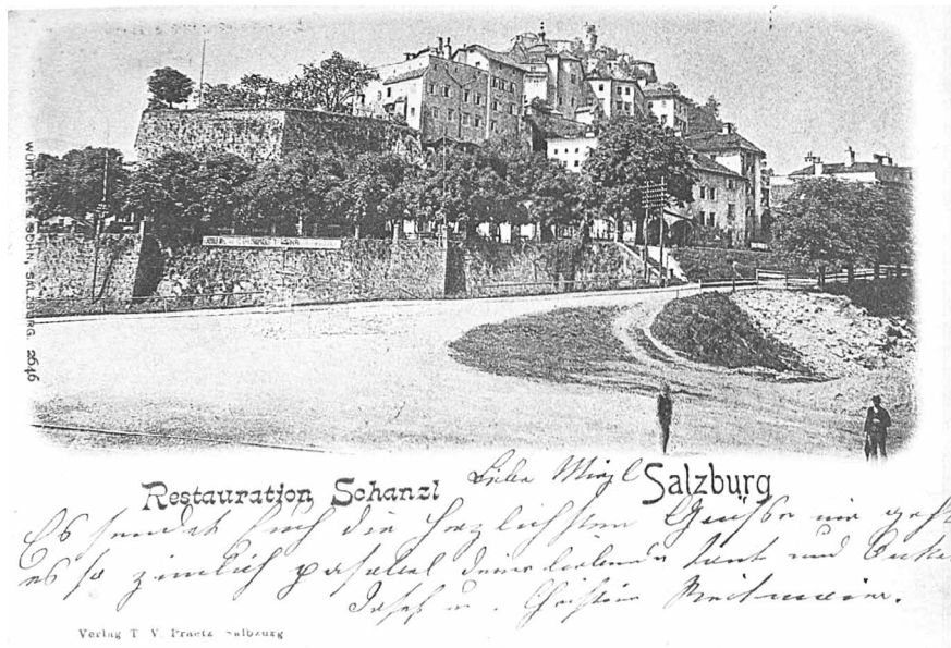
Postkarte „Restauration Schanzlwirt“, noch mit alter Gasse, Benediktinerinnenstift Nonnberg und Festung Hohensalzburg im Hintergrund, um 1900 (SLA, Fotos LBS F 69/7490).

Anlässlich eines Jubiläums stellt sich oft die Frage, welche Geschichte sich dahinter verbirgt: Seit wann gibt es das Gebäude und welche Bedeutung, welche Bewohner hatte es? Warum steht das Haus auf einer Mauer? Was bedeutet der Straßenname „Schanzlgasse“ oder „Stockhausgasse“?