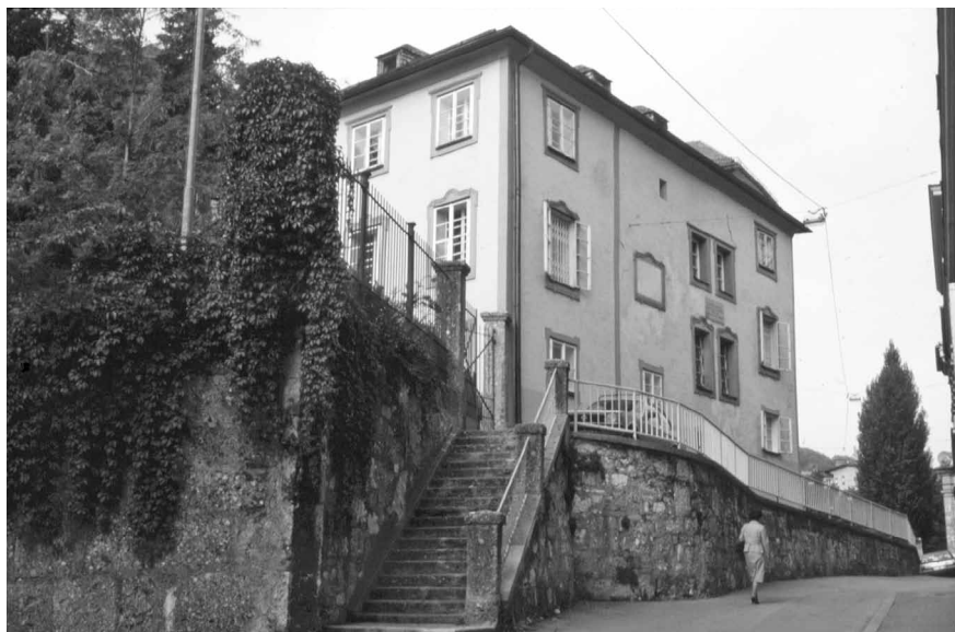
Landeskindergarten, Nonntaler Tor. Im Keller des Hauses befindet sich das Gewölbe eines der ältesten Stadttore Salzburgs. Tonnengewölbte Tordurchfahrt; um 1985 (SLA, Fotos F 004358).