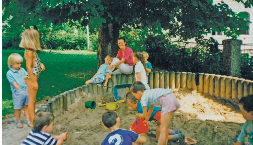
Für den Garten als Teil des Kindergartens wurde gekämpft.