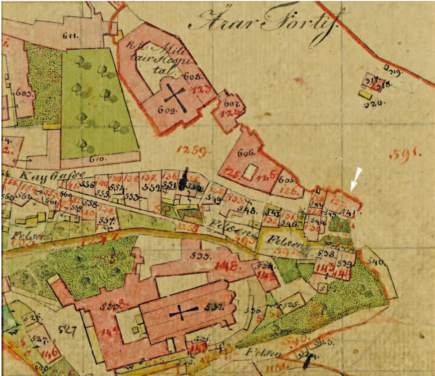
Ausschnitt aus dem Franciszäischen Kataster, Stadt Salzburg, Blatt VI, 1830 (Der weiße Pfeil deutet auf das beschriebene Gebäude) (SLA, FK, Stadt Salzburg, Blatt VI, 1830).

Schanzlgasse Nr. 14 - der Landeskindergarten feiert ein Jubiläum. Seit nun 40 Jahren haben unter anderem Landesbedienstete die Möglichkeit, ihren Nachwuchs in der landeseigenen