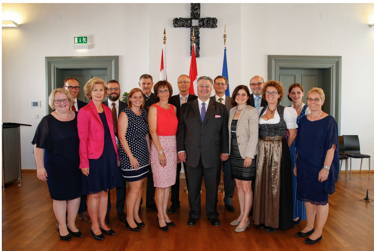
Die Mitarbeiterinnen und Mitarbeiter des Landesrechnungshofes bei der 25-Jahr-Feier