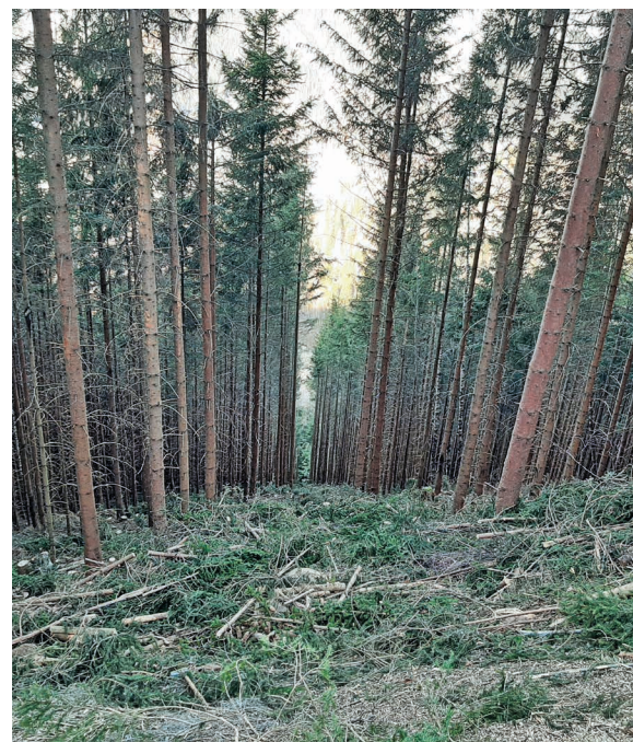
Bei Durchforstungseingriffen ist ausreichend Grünbiomasse zu belassen.

Fördersatz: 60 % auf allen Waldflächen bzw. 80 % auf Waldflächen mit mittlerer bis hoher Schutz- oder Wohlfahrtsfunktion.