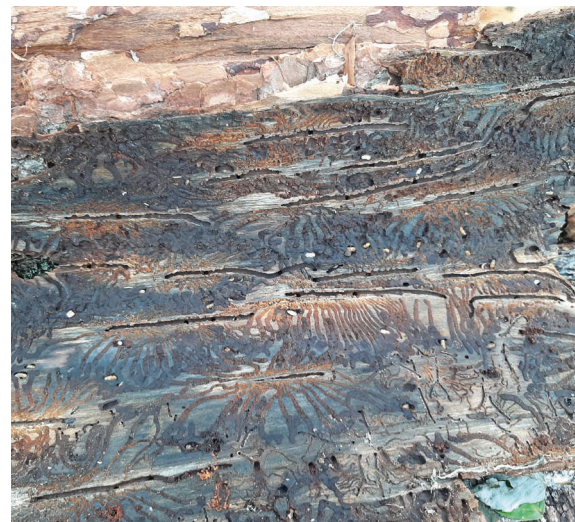
Massenvermehrungen von Forstschädlingen gilt es zu vermeiden.

Vorbeugende Forstschutzmaßnahmen werden nur bei drohender Katastrophalität gefördert. Im Rahmen des Forstschutzes sind im speziellen die Entrindung von bruttauglichem Material, die Vorlage von Fangbäumen sowie die Rüsselkäferbekämpfung förderbar. Zu den förderwürdigen Forstschutzmaßnahmen zählen auch die Adaption von Spezialgeräten (Harvesterköpfe) für die mechanische Entrindung, Maßnahmen zum Forstschutzmonitoring sowie etliche Spezialmaßnahmen wie beispielsweise das Mulchen von bruttauglichem Material. Die Aufarbeitung von Einzelschäden wird ausschließlich im Seilgelände mit Mengen bis max. 50 fm/ha gefördert. Forsthygienisch unbedenkliches Material ist auf Grund des Nährstoffhaushaltes am Waldort zu belassen. Förderprojekte sind in Einzelfallprüfungen mit der Bewilligenden Stelle abzustimmen.