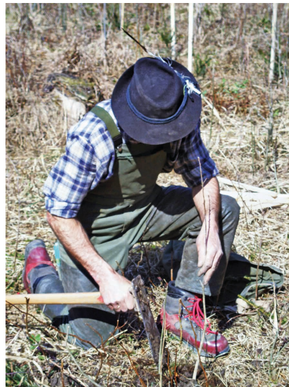
Bei der Aufforstung ist auf eine wurzelgerechte Pflanzung Wert zu legen.