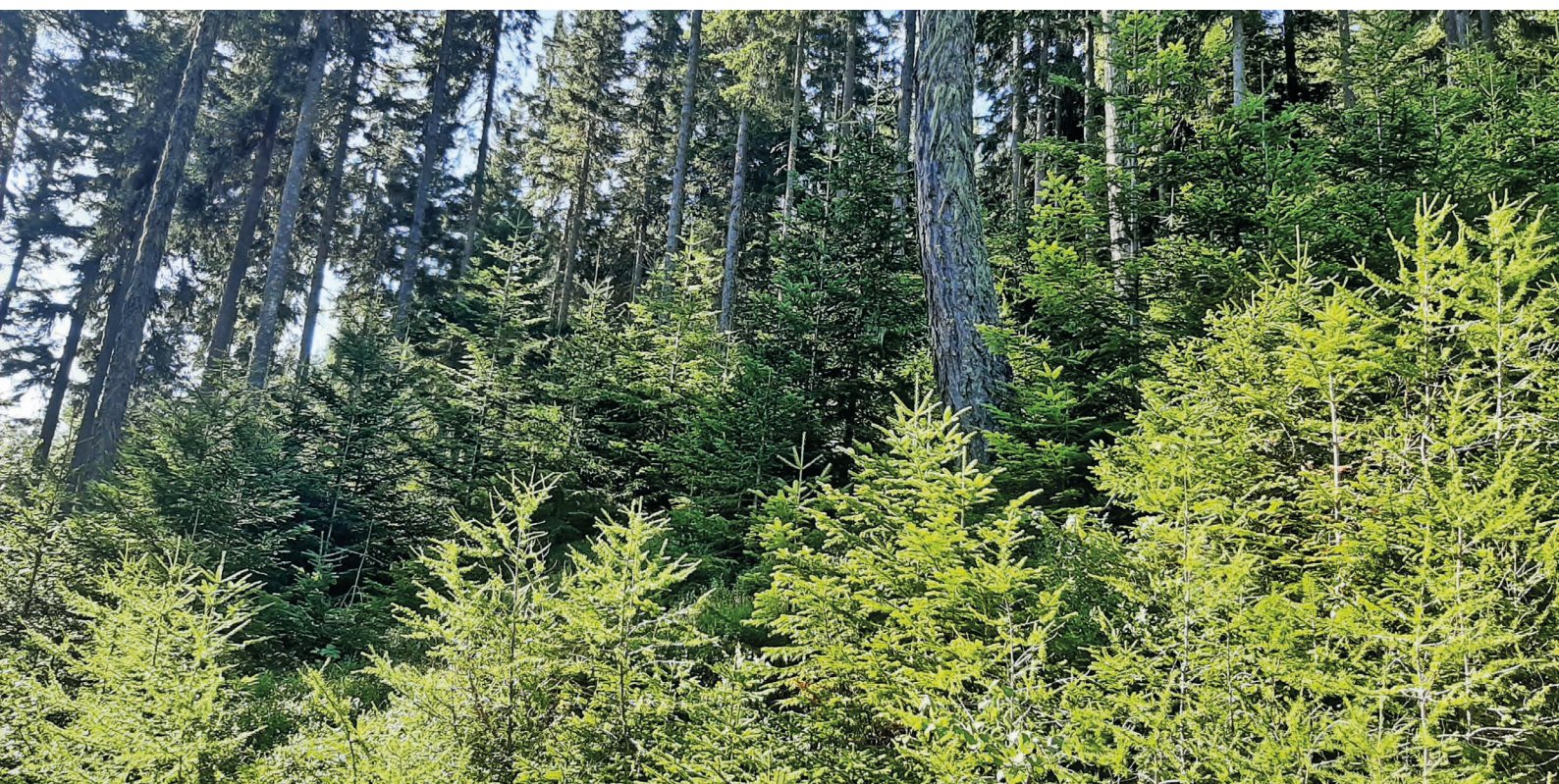
Ergebnis einer gelungenen Vorlichtung ist eine vitale Naturverjüngung.